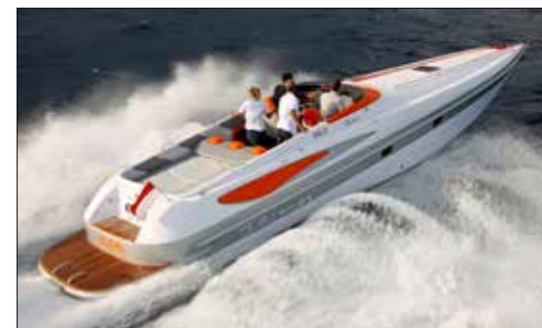
En 2008, Neptune a eu le plaisir d'essayer le Mito 42S de Tullio Abbate au Salon de Cannes. Sensations fortes garanties.