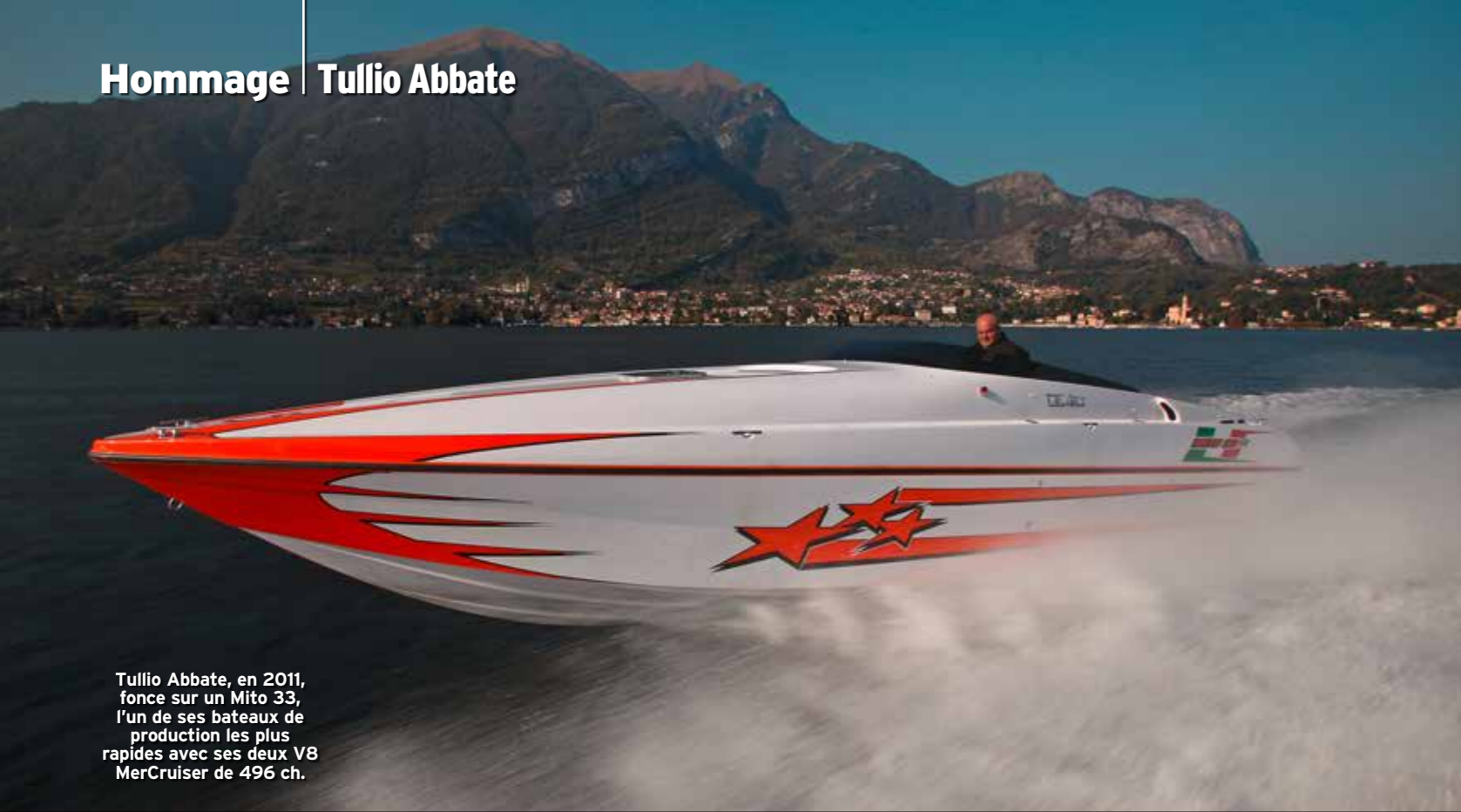
Tullio Abbate, en 2011, fonce sur un Mito 33, l'un de ses bateaux de production les plus rapides avec ses deux V8 MerCruiser de 496 ch.