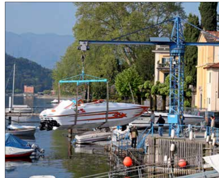
Après une longue tradition de petites unités, il a fallu adapter les équipements du chantier aux dimensions croissantes des bateaux.