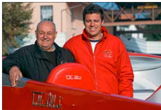
La relève est là avec Tullio Junior, premier des 24 Heures de Rouen et champion du monde d'endurance en 2019.

Depuis 50 ans, des milliers de Sea Star symbolisent la grande réussite du chantier Tullio Abbate. Ici un modèle RS 22 de 2017.