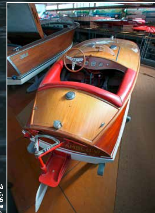
Le musée Guido Abbate, à quelques kilomètres du lac, présente le Pamblo de 1946 qui marque le début d'une grande réussite sportive.