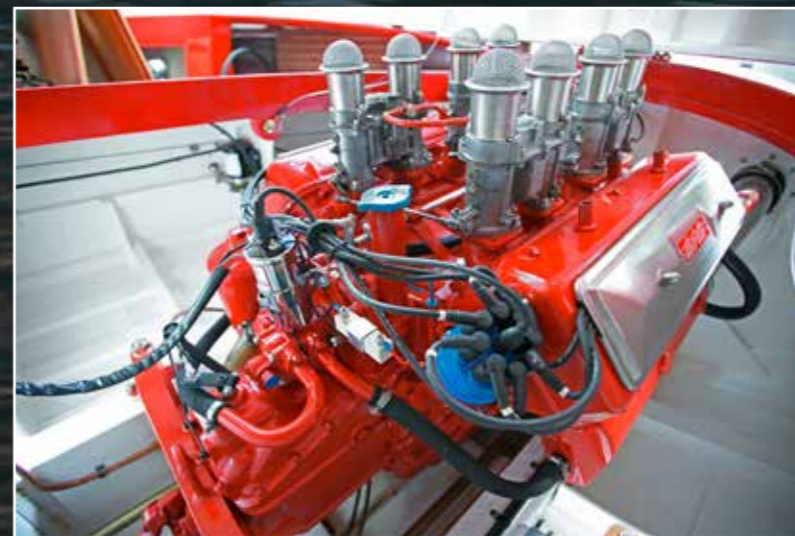
La tradition des moteurs marins italiens BPM remonte aux années 1930. Le V8 Vulcano de 450 ch a toujours séduit Tullio Abbate.